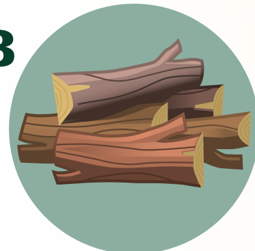
Leña – piezas más grandes de madera seca hasta de 10" de diámetro.