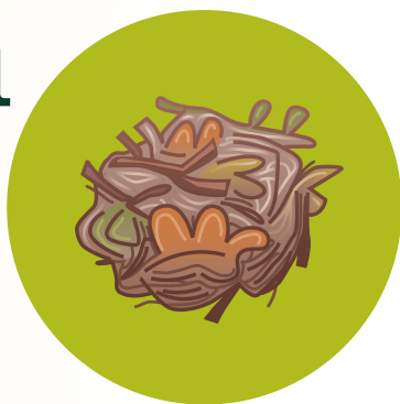
Yesca – varitas pequeñas, hojas, hierba o agujas secas.